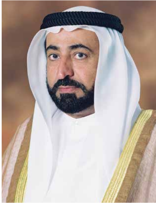
صالح بن الشيخ الدكتور سلطان بن محمد القاسمي عضو المجلس الأعلى حاكم الشارقة